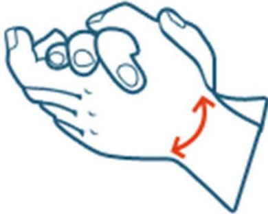
Paume contre paume