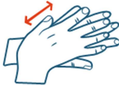
Paume de la main droite sur le dos de la main gauche et paume de la main gauche sur le dos de la main droite