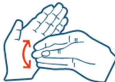
Friction en rotation en mouvement de va-et-vient et les doigts joints de la main droite dans la paume gauche et vice versa.